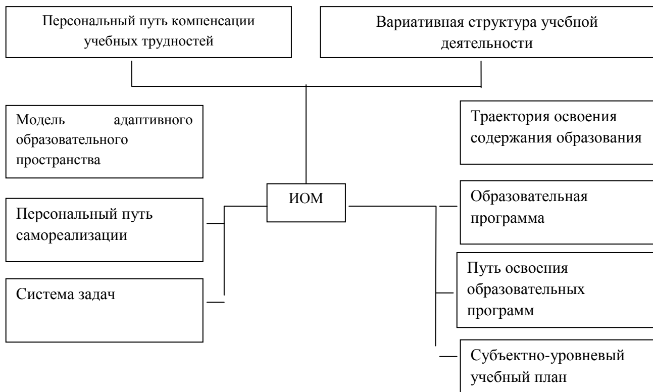
Рис. 1. Интерпретация понятия «индивидуальный образовательный маршрут»

Существующие варианты интерпретации понятия индивидуального образовательного маршрута графически могут быть представлены следующей схемой: