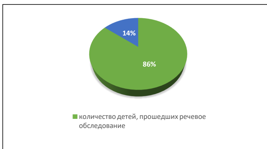
рис. 2 Диагностика речевого развития детей на начало 2016-2017 учебного года.

В рамках нашего исследования проанализированы результаты речевого обследования детей: из 120 детей от 3 до 5 лет выявлены 20 человек с отклонениями в речевом развитии и направлены на ПМПК в Территориальную муниципальную психолого-медико-педагогическую комиссию города Екатеринбурга (ТМПК).