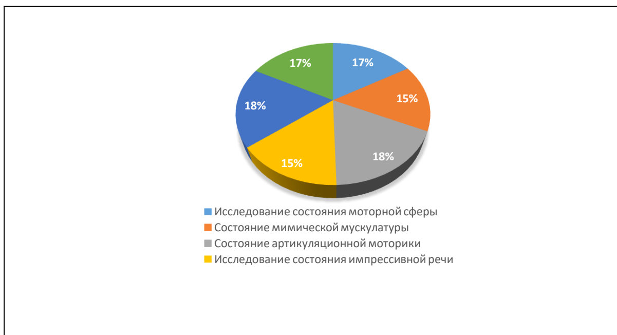
рис. 4 Педагогическая диагностика детей 6-7 лет на выявление речевых нарушений на конец 2016-2017 учебного года.

По результатам педагогической диагностики на конец 2016-2017 учебного года, получены следующие результаты: