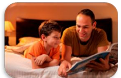
Ծնողների հետ համատեղ ընթերցանությունը երեխայի մեջ