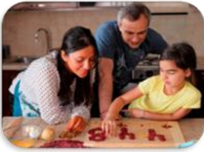
Ծնողները կարող են կիրառել բոլոր միջոցները, որպեսզի սովորեցնեն երեխաներին

Ծնողների հետ ակտիվ համագործակցումն օգնում է ավելի ինքնավստահ դառնալուն: