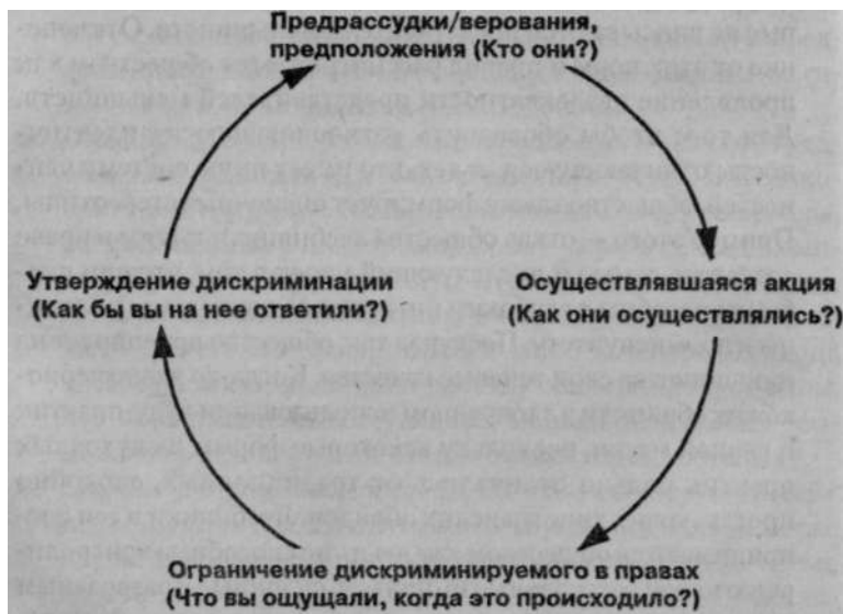
Рис. 1. Дискриминационный цикл (© Fran Walsh, February, 1992, публикуется с разрешения автора)

Утверждение главенства гетеросексуальное™ и дискриминация сексуальных меньшинств, являющиеся следствием институционализированной гомофобии, ведут к попранию прав лесбиянок, геев и бисексуалов в самых различных сферах жизни. Дискриминация может быть представлена в виде следующего цикла (Walsh, 1992). Я предлагаю читателям представить,